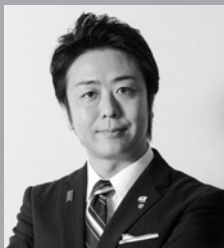
福岡市長 高島宗一郎